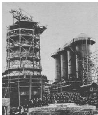
重工業の発展 貧困層の拡大

院長職復活(1890-1901年は委員長)。法改正により行旅病人の収容者が数倍に急増。日清戦争後、工業化と経済発展が進む。