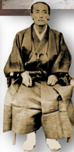
養育院を創った、のちの 東京府知事 大久保一翁

今回、その谷中にさらなる発見があった。舞台は江戸時代に遡る。文久二年、谷中の地（了侘寺より七、八分の一乗寺隣）で、大久保一翁（当時は大久保越中守）が近藤七郎右衛門の屋敷を授受したという記録が残っていたのだ（『東京市史稿（市街篇四六）』）。