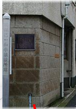
暗殺現場である塙次郎邸跡前 (東京都千代田区九段)