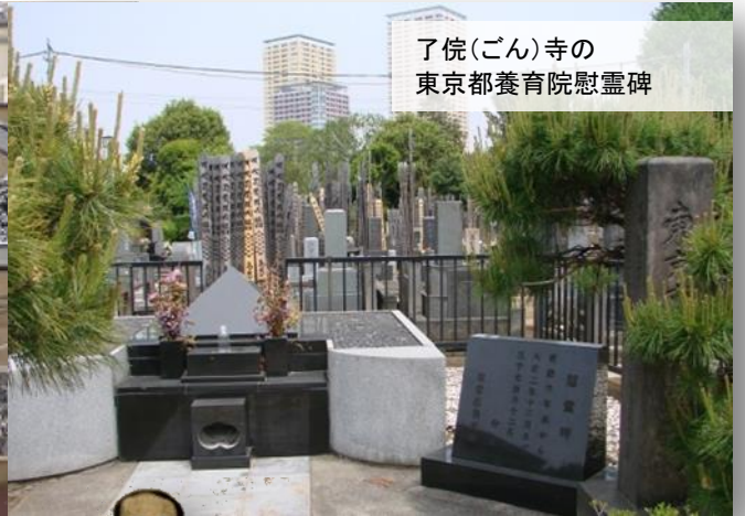
了侘(ごん)寺の 東京都養育院慰霊碑