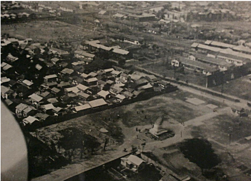
空襲の跡がのこる養育院の敷地と渋沢栄一銅像