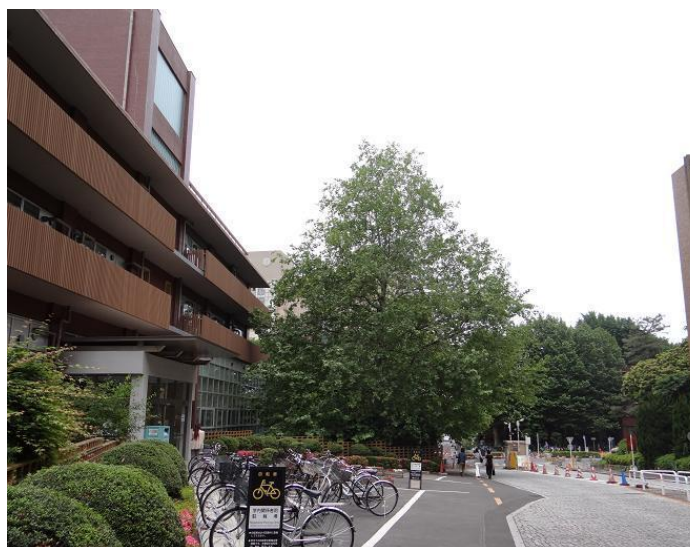
東大医学図書館前の、樹齢30年余のヒポクラテスの木。遠くに新校舎の塔が望みできるが、医学のシンボルの医神・アスクレピオンの杖が描かれている。

最盛期、黄色輪の樹幹であったが、巨大な空洞ができ、樹皮でろうじて立ち、鉄枠で支えられている。2本の葉(ひこばえ)が大きく育つ。