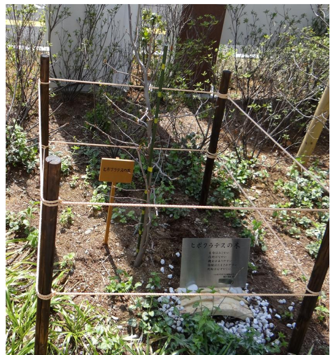
2012年秋入手 2014年4月定植

2005年ころ、ある思いがあって、アンケート調査、ネット情報の収集により、日本国内のヒポクラテスゆかりの木について調査をした。日本国内で100本以上のヒポクラテスの木が育てられていることが判明し、それらの木の由来と系統を日本医史学会に報告した。その後の調査情報も含めて、入手者の系統