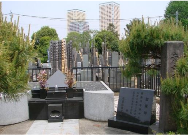
東京都台東区谷中・了侘(ごん)寺 碑の設置の最中、激しい雨が降り終わると、きれいに晴れ上がり、物故者が喜んでいるようでした。