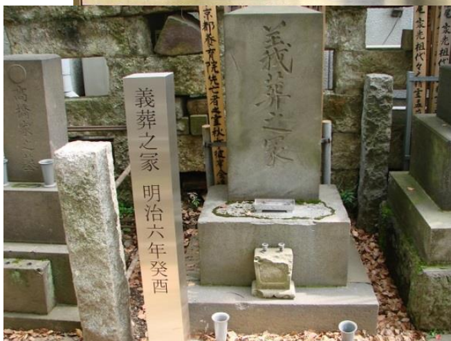
東京都台東区谷中・大雄寺。 背面の記載： 明治六年癸酉始養窮民於養育院其死者葬此