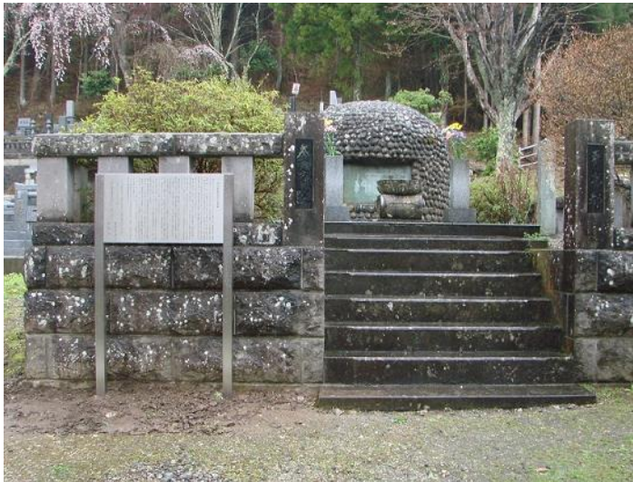
栃木県塩原・妙雲寺 先の大戦中の疎開先の栃木分院における無縁仏のお墓です。

平成二十二（二千十）年四月 養育院を語り継ぐ会 この碑は元養育院職員等の篤志によって建てられました。妙雲寺