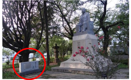
本院跡碑の「養育院本院」の文字は 渋沢栄一の墨跡を刻字したものです。 (碑文は櫻園通信 2 号参照)

養育院は明治五年に開設以来、首都東京の社会福祉の大きな部分を担ってきました。平成 11 年 12 月養育院廃止条例をもって廃止されるまで、127 年の歴史がありました。その歴史を見ると日本の福祉・医療の展開に大きく貢献してきています。しかし、人の記憶はだんだん薄れ、記憶を持つ人も少なくなっています。養育院の存在を後世に伝えていくことが大切と考える元職員、退職者が集まって、養育院で亡くなられ、引き取り手のない方々の合葬墓を説明する碑を建てようということになりました。そのための寄付を募ろうということになり何回もの準備会をへて、平成 17 年 7 月「養育院を語り継ぐ会」を結成しました。