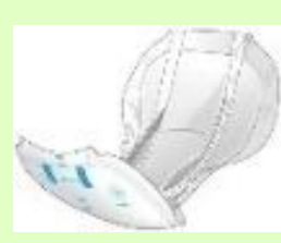
【④尿取りパッドパンツ用】