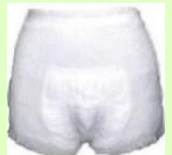
【③紙おむつパンツタイプ】