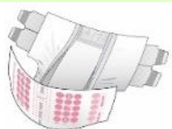
【①紙おむつテープタイプ】