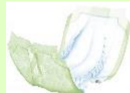
【②尿取りパッドテープ用】