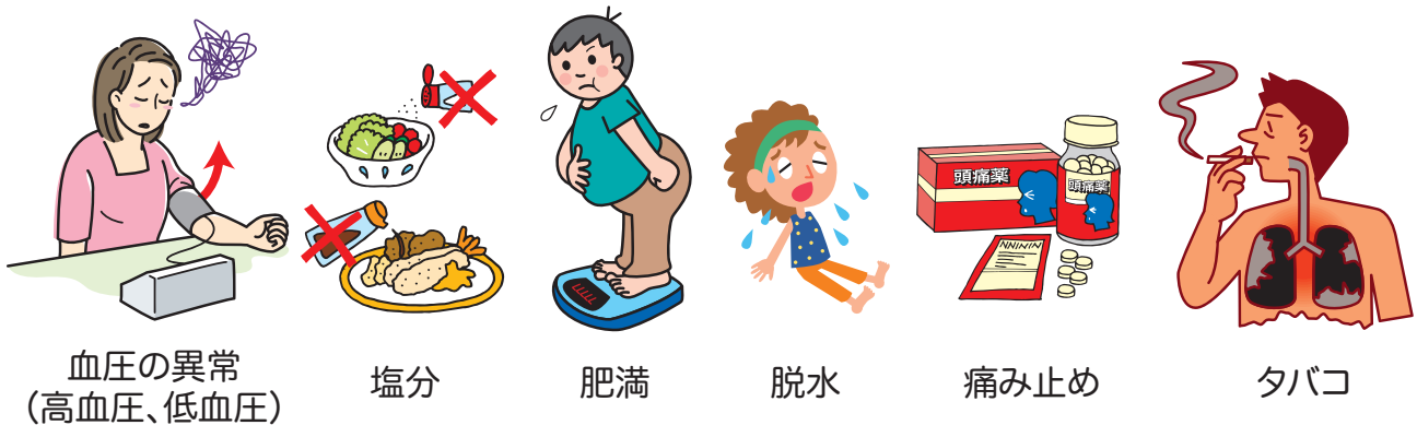
図3 腎臓はこんなことで悪化する

慢性腎臓病になるリスクが高いのは、糖尿病と高血圧をお持ちの方です。血糖値や血圧のコントロールが悪いと、ほとんど自覚症状がないままに腎障害を悪化させてしまいます。主治医と相談しながら、血糖や血圧の管理をしっかり行いましょう。腎臓病は、血糖や血圧以外にも、塩分の多い食事、喫煙、肥満、脱水、消炎鎮痛薬などの薬剤によっても悪化してしまいます（図3）。規則正しい生活習慣を心がけましょう。