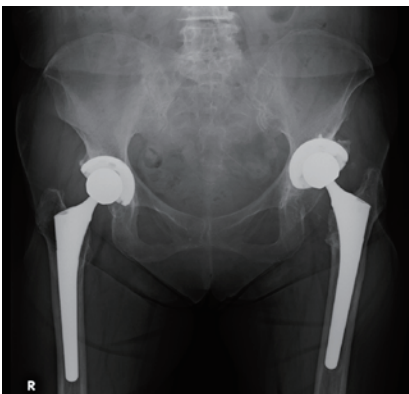
図4 図3の方の人工股関節術後