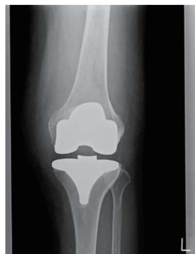
図2 図1の方の人工膝関節術後