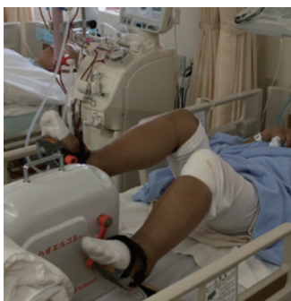
図4 透析中の運動療法

尿蛋白陽性となった方、腎機能の低下を指摘された方は将来透析にならないように、ひとたび透析になってしまった方は“元気な”透析患者でいられるように、我々腎臓内科・血液透析科スタッフがサポートいたします（図4）。