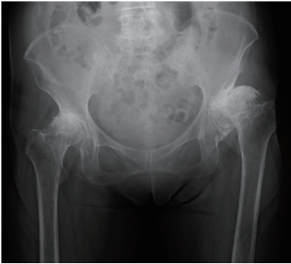
図3 変形性股関節症

また当科は東京大学が行っている術後創部感染調査に参加しておりますが、リスクが特に高い糖尿病合併例を除けば術後感染は皆無であり、良好な治療環境に基づくすぐれた成績と自負しております。