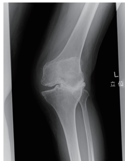
図1 変形性膝関節症

当科も専門医師が多く所属しておりますので、医療連携もしくは患者さまのご希望による専門治療施設の検索が容易に可能となりますよう、人工関節センターを標榜致しました次第です。