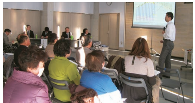
写真2 気仙沼市での公開シンポジウム風景