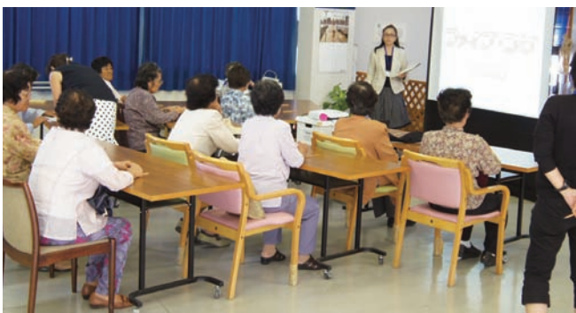
写真1 宮古島市での説明会風景