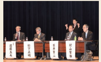
第127回老年学公開講座（P7参照）