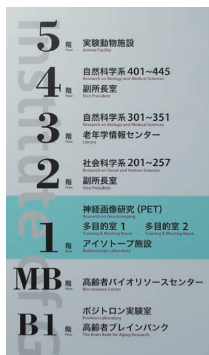
写真2 各フロアの案内