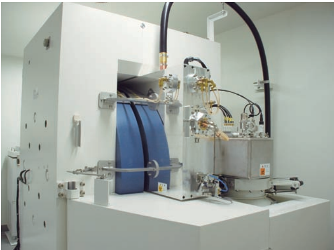
写真3 サイクロトロン

活用されます。PET 診療エリアは、病院のアイソトープ (SPECT) 検査エリアと一体化しており、今後、臨床と基礎のより一層の連携強化が図られるものと期待されます。RI 関係施設には、従来、運営上あるいは施設整備の経緯などから、病院の放射線科、研究所の RI 実験室と仲町の附属診療所がそれぞれ異なる事業所として放射性同位元素使用施設の許可を受けていました。しかし、新施設建設を機に一事業所として使用許