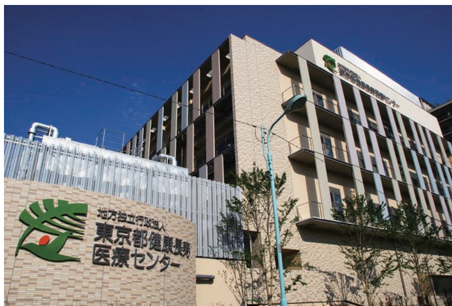
写真1 新研究所の外観

研究所1階には多目的室（写真4）、PET診療エリア（写真5）とRI総合実験室があります。多目的室は、従来の社会科学系を中心とした各種事業の他、まとまった人数を収容できる施設としてさまざまなイベントに